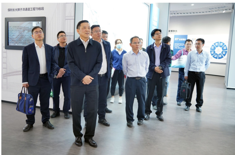
省社保局调研组到沙田镇参观调研

据了解,新政策主要从调整我市医疗保障制度框架、设置各险种参保缴费费率、调整基本医疗保险待遇支付政策等方面着手,