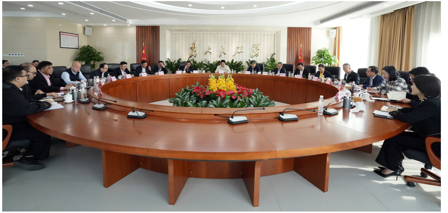
沙田镇召开领导班子学习贯彻习近平新时代中国特色社会主义思想主题教育专题民主生活会

要在抓实问题整改中提升政治担当。坚决扛起整改主体责任,对本次民主生活会查摆出来的问题进行全面梳理,细化、分解整改任务,明确整改时限,以“钉钉子”精神抓好问题整改,确保各类问题得到彻底解决。同时,注重“当下改”与“长久立”相结合,探索建立长效机制巩固整改成效,推动每一个问题都有结果、见效果,经得起历史、实践和人民的检验。